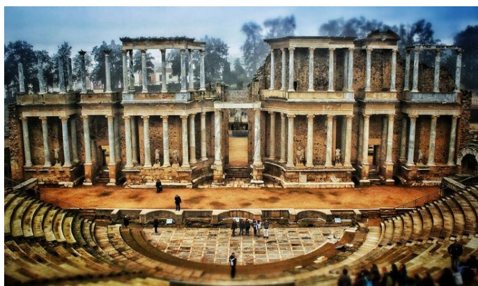
Le Théâtre Antique de Mérida :